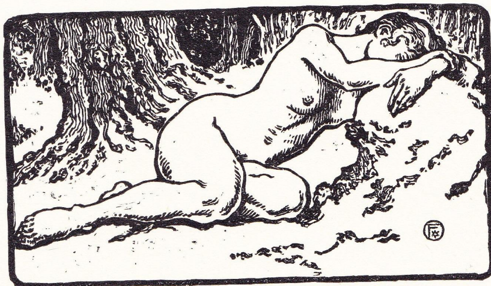
Dessin de JEANNIOT, gravé par Ernest FLORIAN, pour Le Misanthrope , 1907. (Coll. Helleu-Sergent; pl. originale.)